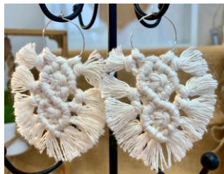
ATELIER PLUMBAGO Véronique GASCON Objets en macramé